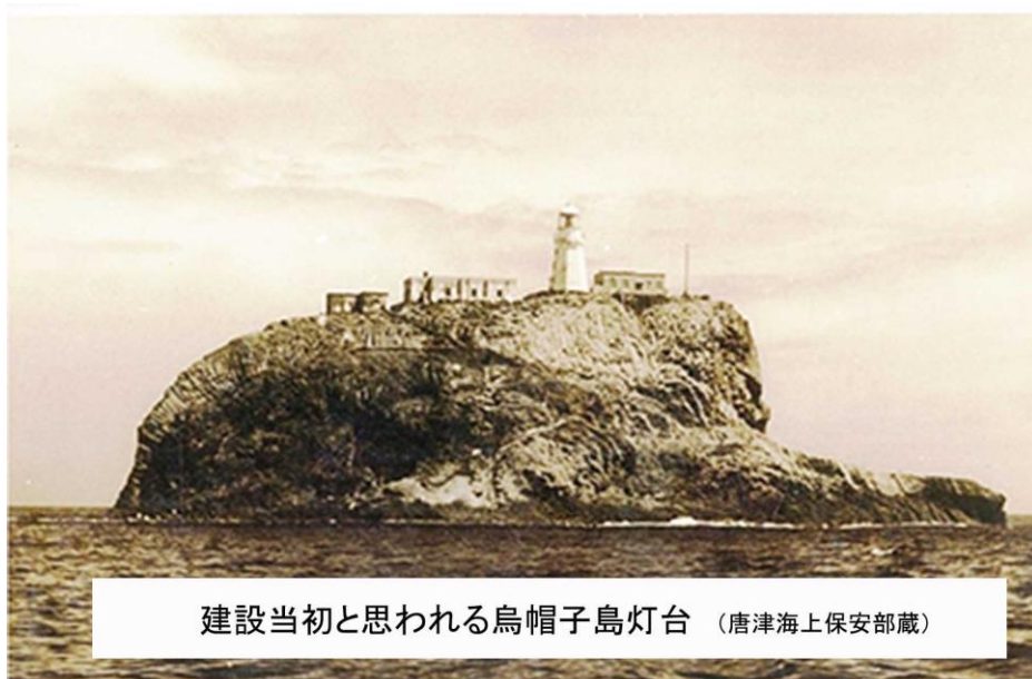
建設当初と思われる烏帽子島灯台

貯水庫は石造平屋建、壁体はルスティカ積、官舎と対照的な意匠を呈する。内部は中央を石造の壁で二室に区画され、それぞれ東側に出入り口、北半は北側と西側、南半は西側と南側に、鉄扉を吊った窓を開く平面に復原できる。石造の壁内側には胴縁を打つためのダボ跡が残されるので、当初は官舎と同様、木造大壁造の内壁が張ってあった可能性が高く、住居として利用されたようだ。その後、貯水庫として利用され、屋根はコンクリート造陸屋根に改造されているが、石造壁体上部内