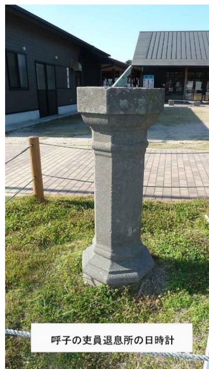
呼子の吏員退息所の日時計

急な坂道を登ると六段程の大きな石段が道の左脇にあり、門柱を基点とした五寸四方の角材が格子状態に組まれ塀をなしてあります。旧灯台官舎の建物です。格子状の角材も、官舎の壁面も白ペンキで仕上げられており、その場所は近場では見慣れぬ光景であり、一入目に焼きつく感じだったことでしょう。