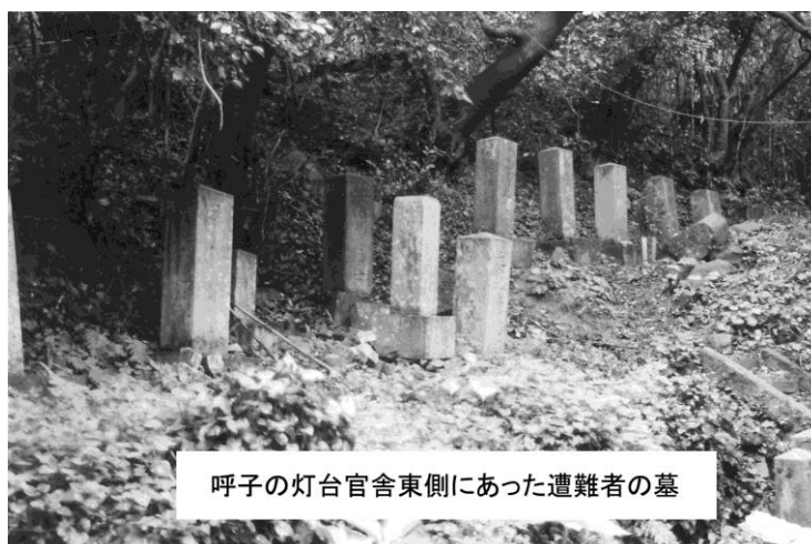
呼子の灯台官舎東側にあった遭難者の墓