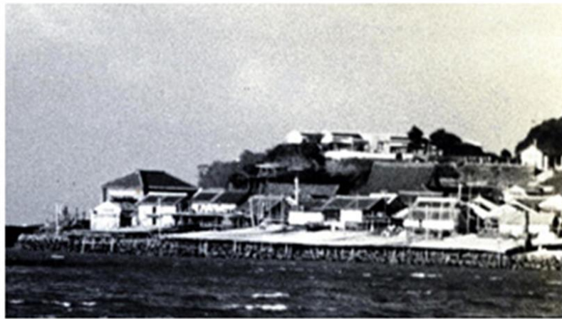
呼子町先方の丘の上の灯台官舎

一般の人の島への上陸は認められていません。島の水ぎわは「雷さんのつめ」の宝庫です。それらで一杯にした袋は帰りの良い土産です。楽しさの上に嬉しさも加わる島でした。 7